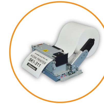
Imprimante tickets 80MM