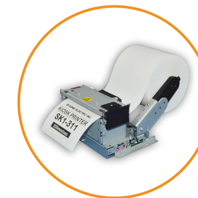
Imprimante tickets 80MM