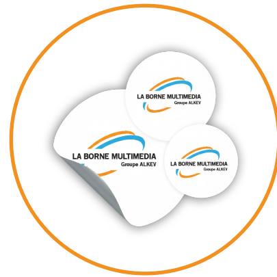
stickers adhésif / Magnétique