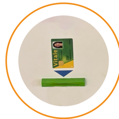
Lecteur carte vitale