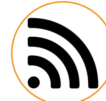
Kit wifi ou 4G