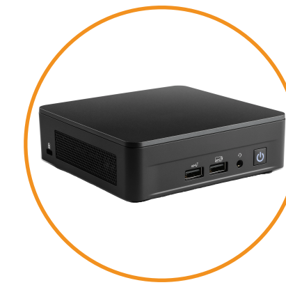
Mini PC Windows ou Linux / Player Android