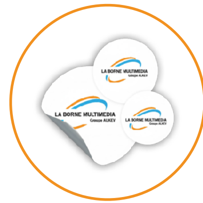
stickers adhésif / Magnétique