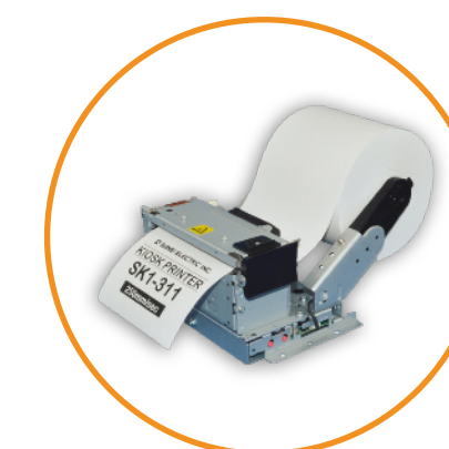
Imprimante tickets 60 / 80MM