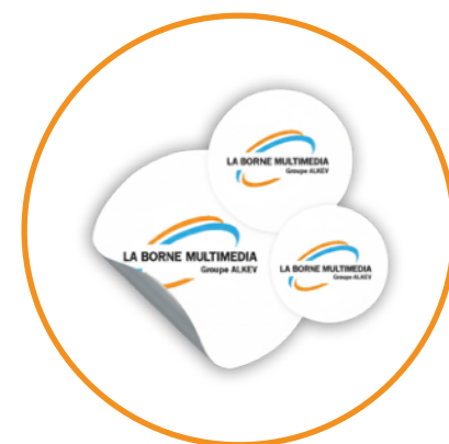
stickers adhésif / Magnétique