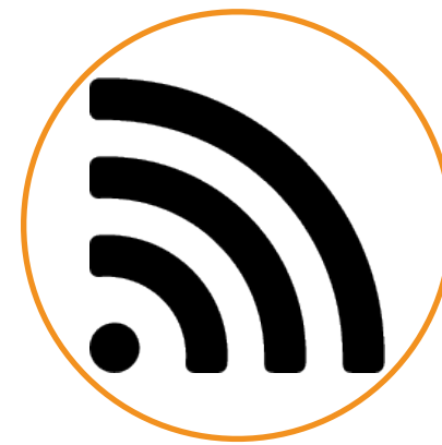
Kit wifi ou 4G