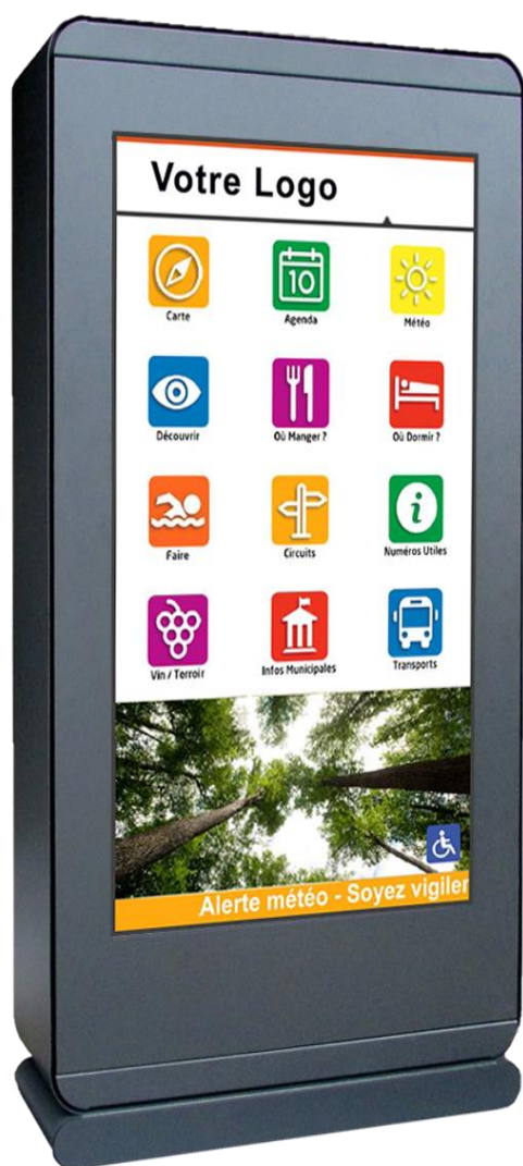
Dimensions 65 pouces