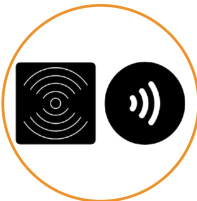
Lecteur RFID / NFC