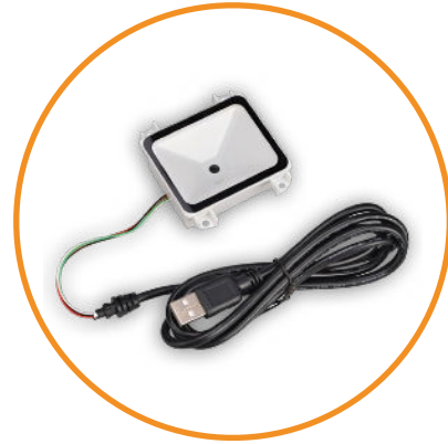
Lecteur QR CODE 1D/2D