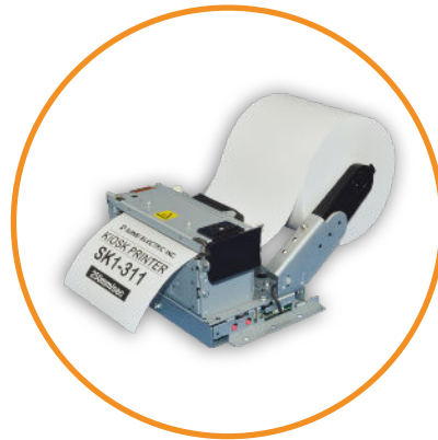
Imprimante tickets 80MM