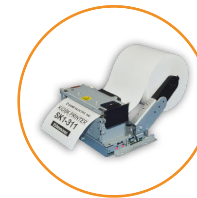
Imprimante tickets 80MM