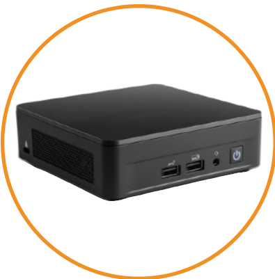
Mini PC Windows ou Linux / Player Android