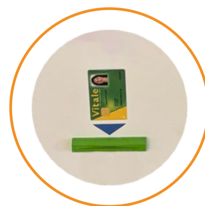
Lecteur carte vitale