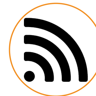
Kit wifi ou 4G