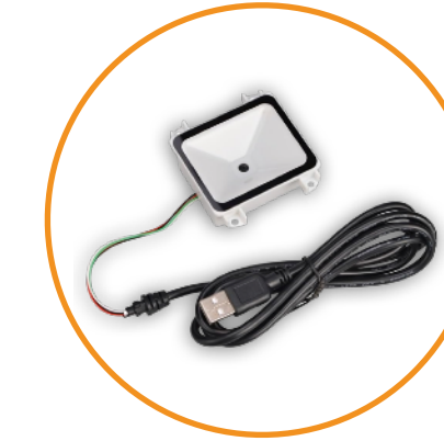
Lecteur QR CODE 1D/2D