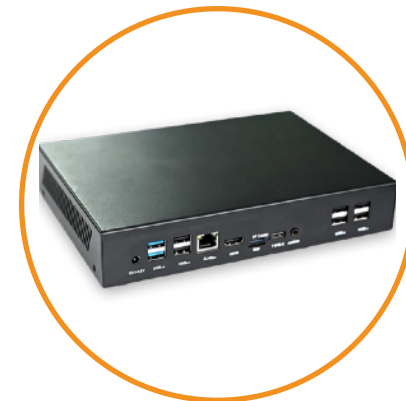
Mini PC Windows ou Linux / Player Android