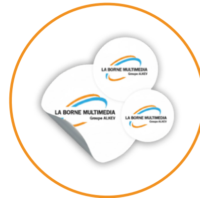
stickers adhésif / Magnétique