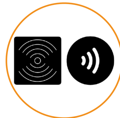
Lecteur RFID / NFC