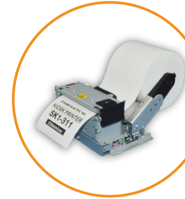
Imprimante tickets 80MM