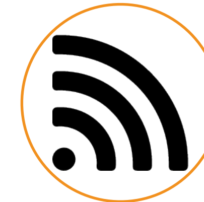
Kit wifi ou 4G