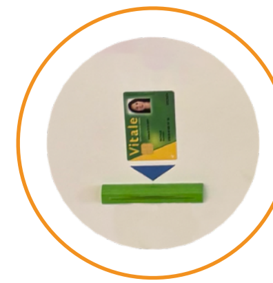
Lecteur carte vitale